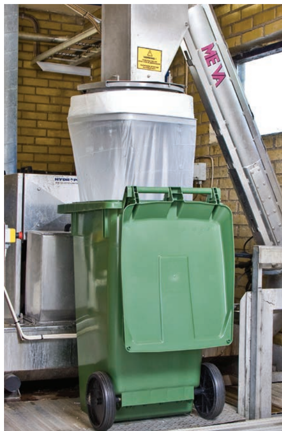
Die kommunale Kläranlage im schwedischen Stafanstorp nutzt Longopac Fill für den Umgang mit Rechengut.