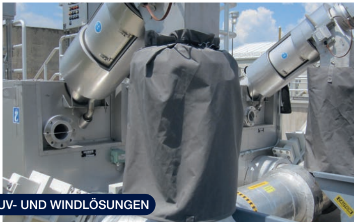
UV- UND WINDLÖSUNGEN