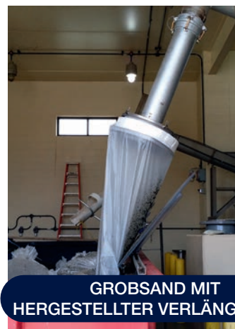
GROBSAND MIT HERGESTELLTER VERLÄNGERUNG

Paxxo rüstet kundenspezifisch Ausgabeverlängerungen nach, damit die Adapter Longopac Fill 1H und 2V an bestehende Anlagen nachgerüstet werden können. Darüber hinaus bieten wir jetzt auch eine Doppelrollenlösung, die als UV- und Windschutz dient. Dieses Produkt verhindert, dass der Magazinsack vom Wind weggeblasen wird. Im Lieferumfang sind die erforderlichen Komponenten für eine Montage an der vorhandenen Anlage enthalten.